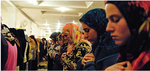
Foto: Regina Maria Suchy, Religion nebenan , Don Bosco München 2009

Idee und Fotos: Regina Maria Suchy Text: P. Dr. Cornelius Bohl OFM