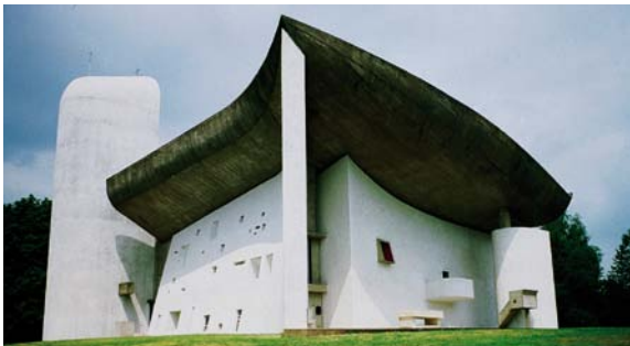
Abb: Notre Dame du Haut, Ronchamp (Frankreich), Kirche des berühmten Architekten Le Corbusier

Dabei lassen wir uns von den Worten des Vorsitzenden der Deutschen Bischofskonferenz, Erzbischof Robert Zollitsch, leiten, der bei der Verabschiedung des ehemaligen EKD-Vorsitzenden Wolfgang Huber darauf hinwies, „sich nicht nur das noch nicht Erreichte, sondern auch die schon erlangten Gemeinsamkeiten vor Augen zu führen“. Nun ist es an der Zeit, dass die christlichen Kirchen ihre gemeinsamen Positionen nicht nur formulieren, sondern bei der Gestaltung unseres Gemeinwohls bewusst mit einbringen.