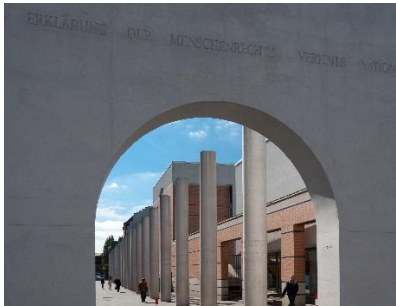
Abbildung 1:

Vorderseite Karte 1, Bild: Tor zur Straße der Menschenrechte