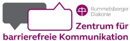
Abbildung 2: Logo vom Zentrum für barrierefreie Kommunikation der Rummelsberger Diakonie.

Menschen mit Lern-schwierigkeiten haben einen großen Teil der Texte auf Verständlichkeit geprüft.