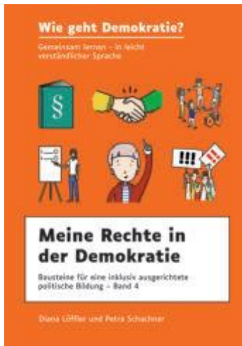
Abbildung 14: Viertes Buch: Meine Rechte in der Demokratie.