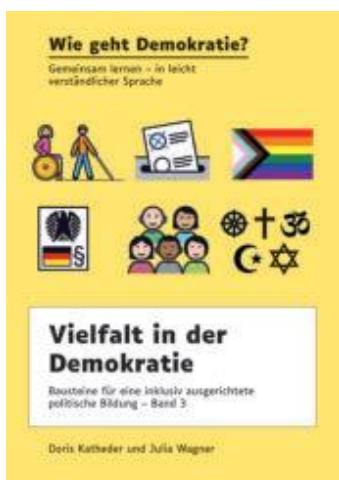
Abbildung 13: Drittes Buch: Vielfalt in der Demokratie.