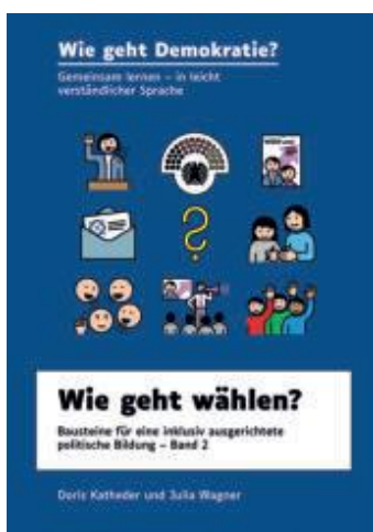
Abbildung 12: Zweites Buch: Wie geht wählen?.