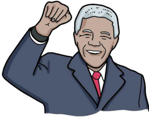
Abbildung 15: Zeichnung von Nelson Mandela.