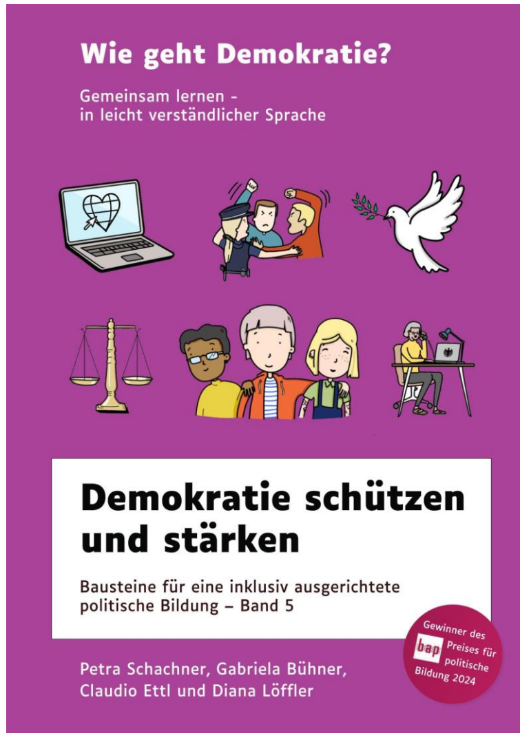
Abbildung 1: Vorderseite Buch.

Bausteine für eine inklusiv ausgerichtete politische Bildung. Fünfter Band.