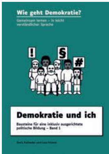
Abbildung 11: Erstes Buch: Demokratie und ich.

Dieses Buch gehört zu der Buch-reihe „Wie geht Demokratie?“. Eine Buch-reihe besteht aus mehreren Büchern zu einem Thema. Diese Buch-reihe besteht aus 5 Büchern: