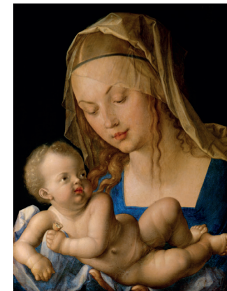
Albrecht Dürer: Maria mit der Birnenschnitte, 1512